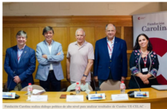
Fundación Carolina realiza diálogo político de alto nivel para analizar resultados de Cumbre UE-CELAC – .

— Hoy, 27 de julio, ha tenido lugar en la sede de la UIMP del Real Sitio de La Magdalena (Santander, España) el diálogo político de alto nivel "América Latina y el Caribe y la UE, una alianza renovada", marco del curso de verano "América Latina y la UE, socios en un mundo cambiante: Una nueva etapa en las relaciones UE-CELAC", que se lleva a cabo del 24 al 28 de julio. El curso está organizado por la Fundación Carolina y la Menéndez Pelayo International University, y cuenta con el patrocinio del Gobierno de Cantabria y el apoyo del Servicio Europeo de Acción Exterior (SEAE).