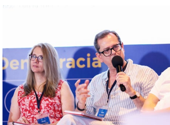
Instancias de diálogo y laboratorios en los encuentros de debate realizados en los Centros de Formación de AECID