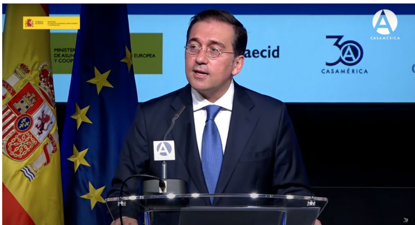
Ministro de Asuntos Exteriores, Unión Europea y Cooperación, José Manuel Albares, durante el lanzamiento de la iniciativa "Por un nuevo contrato social. Renovar la democracia para no dejar a nadie atrás", en CASAMÉRICA, Madrid.

El Programa representa una apuesta de la Cooperación Española a través de la AECID por llevar a cabo acciones específicas de impulso a los procesos democráticos en diferentes contextos, así como por potenciar la mirada democrática en el conjunto de actuaciones de la Agencia con América Latina y el Caribe, como un valor que permita no solo imaginar escenarios deseables de futuro sino promover las condiciones para que esos horizontes sean posibles.