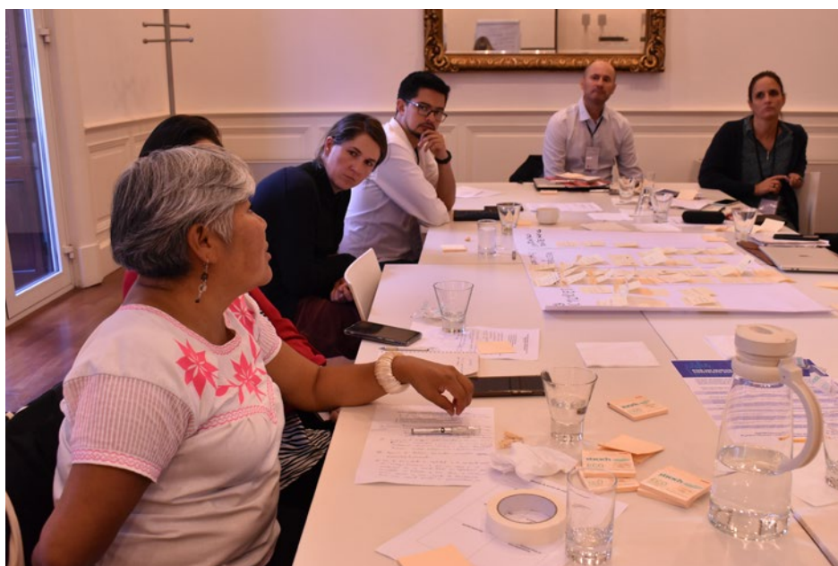
Laboratorio, encuentro en Montevideo

El primer Encuentro se celebró en Montevideo, Uruguay, los días 5 y 6 de mayo , y convocó a actores de la sociedad civil. Este primer Encuentro estuvo orientado a trabajar sobre el papel de los medios de comunicación, comunicadores y periodistas, así como sobre las demandas de distintos movimientos, grupos y sectores de la población (mujeres, jóvenes, personas LGTBI, grupos ambientalistas, indígenas y afrodescendientes).