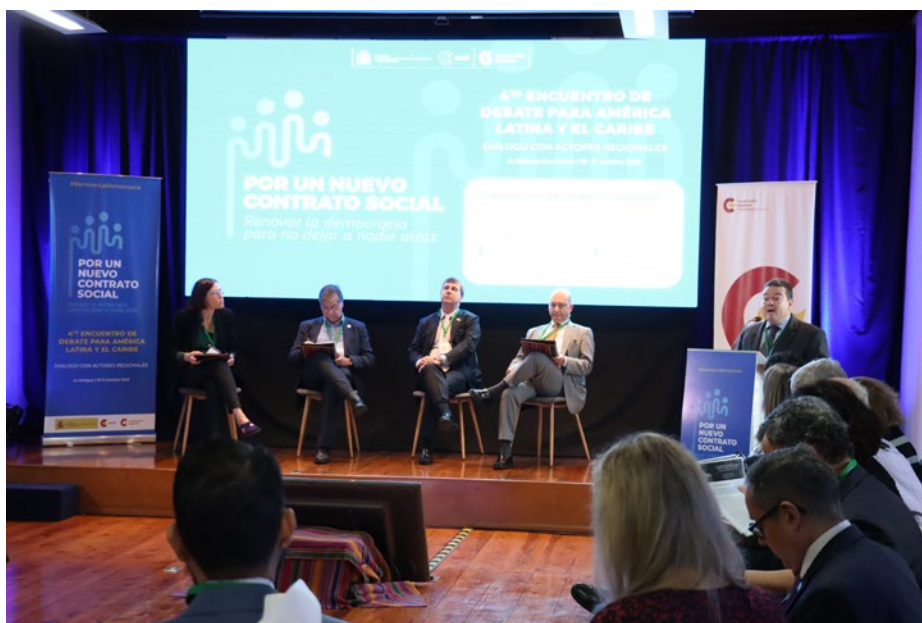
Inauguración, encuentro en La Antigua