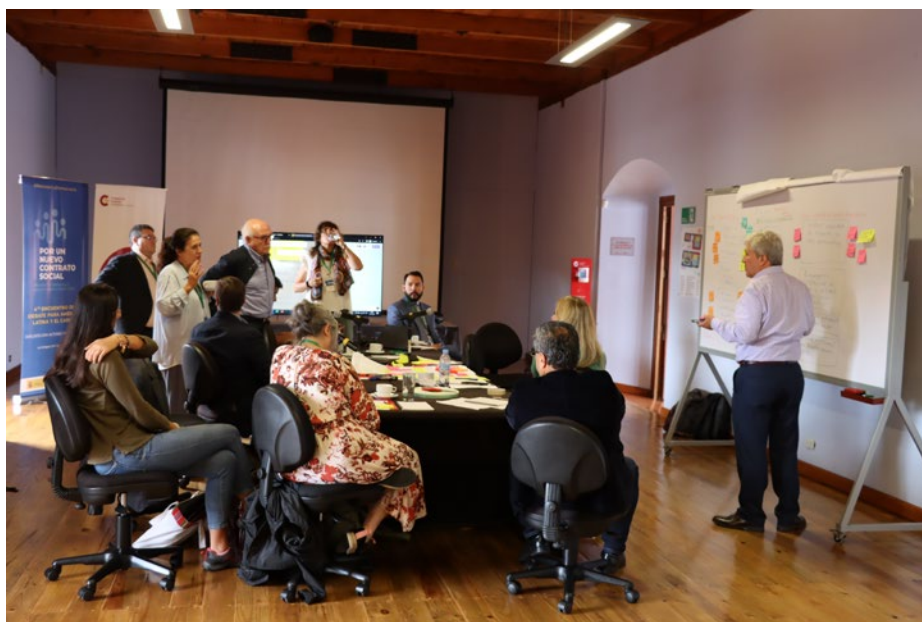
Laboratorio, encuentro en La Antigua