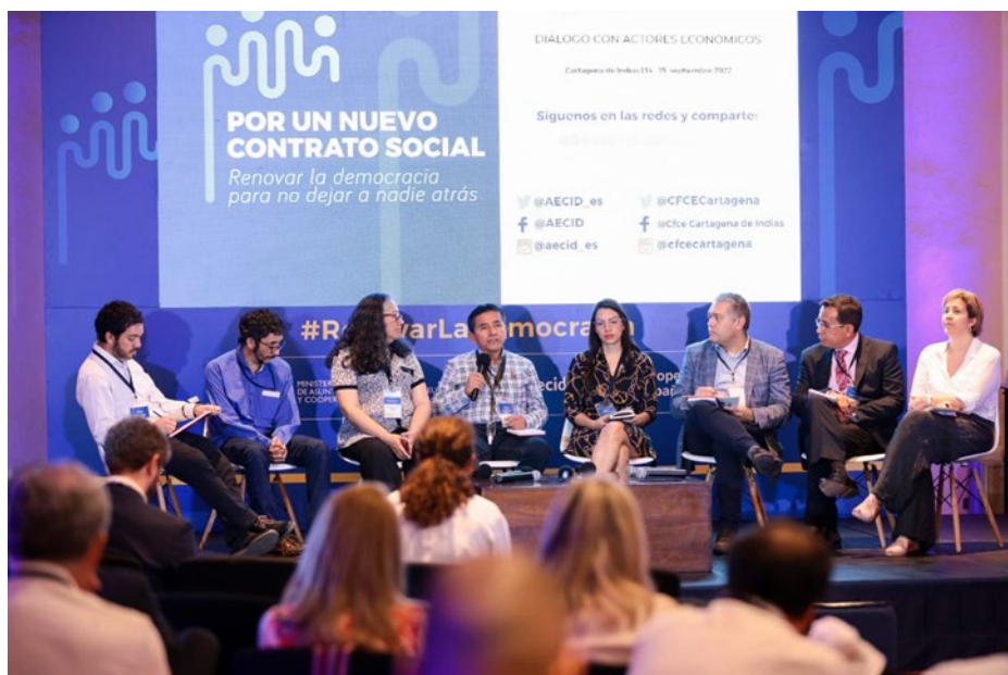
Diálogo, encuentro en Cartagena de Indias

El tercer encuentro tuvo lugar en Cartagena de Indias, Colombia, el 14 y 15 de septiembre , y convocó a actores económicos y agentes sociales. En este Encuentro se abordaron, entre otros temas, la necesidad de impulsar un nuevo contrato social que incluya a todos los actores de forma más equitativa, la reforma fiscal, la informalidad del empleo, los modelos de negociación colectiva y el modelo de producción, con especial énfasis en la superación de los modelos de matriz extractivista.