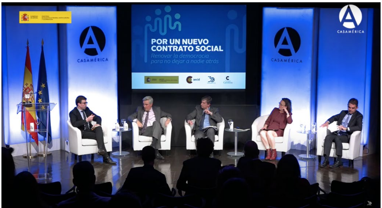
Instancia de debate durante el lanzamiento de la iniciativa "Por un nuevo contrato social. Renovar la democracia para no dejar a nadie atrás", en CASAMÉRICA, Madrid.

Para lograr tales fines, el Programa prevé la celebración de un conjunto amplio de actividades que tienen la democracia como temática transversal y que se concretan en la emergencia de nuevas narrativas y diálogos sobre la democracia, el fomento de una visión garantista y ampliada de derechos, la reflexión sobre nuevas formas de representación política y social, la protección de la libertad de expresión y de información, y el refuerzo de los mecanismos de transparencia y rendición de cuentas.