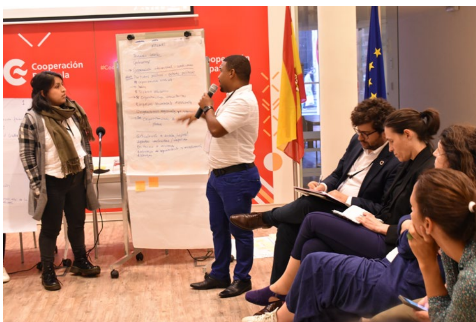
Instancia de plenaria, encuentro en Montevideo