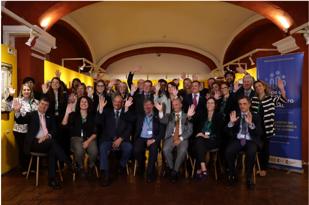
Foto grupal encuentro en La Antigua, Guatemala