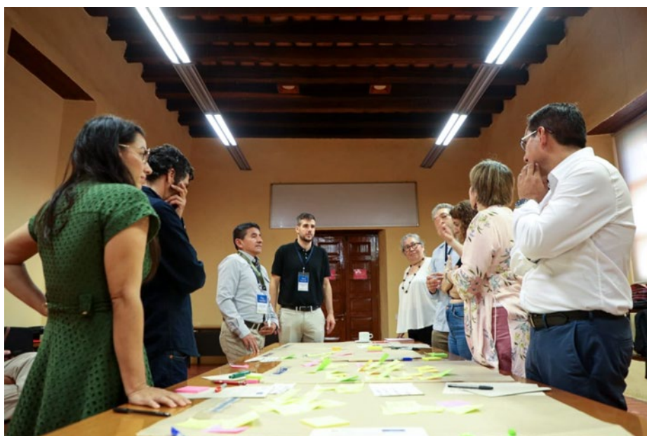
Laboratorio, encuentro en Cartagena de Indias