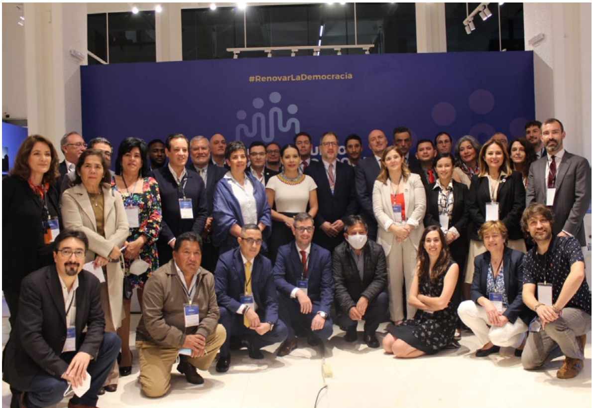
Foto grupal encuentro en Santa Cruz de la Sierra, Bolivia