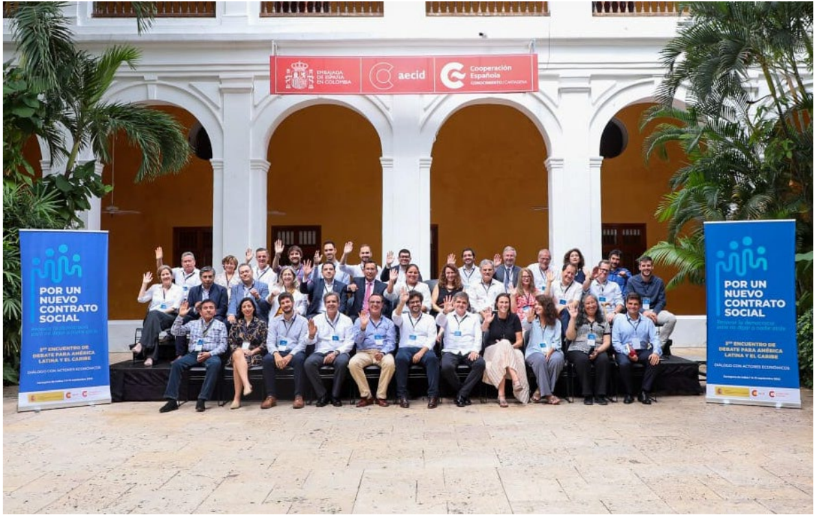
Foto grupal encuentro en Cartagena de Indias, Colombia