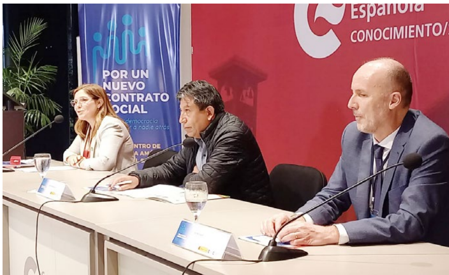
Inauguración encuentro en Santa Cruz de la Sierra

El segundo encuentro se celebró en Santa Cruz de la Sierra, Bolivia, el 9 y 10 de junio , y congregó a distintos actores políticos de la región, procedentes tanto de movimientos políticos tradicionales como de fuerzas emergentes. Las principales líneas temáticas que se abordaron fueron el funcionamiento de las instituciones políticas, la calidad de la gestión pública y de la justicia, la estabilidad y pluralidad de los sistemas de partidos, la capacidad de representación de partidos y movimientos políticos, la creación de espacios de diálogo político, la conexión entre partidos y movimientos sociales, el reconocimiento de la diversidad sociocultural y étnico-racial de los países y la protección efectiva de los derechos de los pueblos indígenas y originarios y de las personas afrodescendientes, y la creación de agendas políticas compartidas.