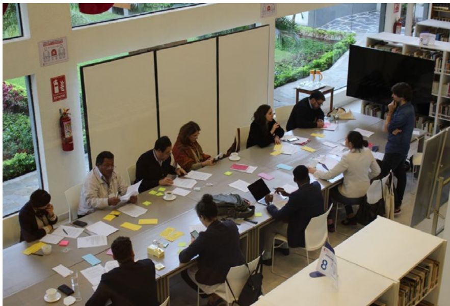
Laboratorio, encuentro en Santa Cruz de la Sierra