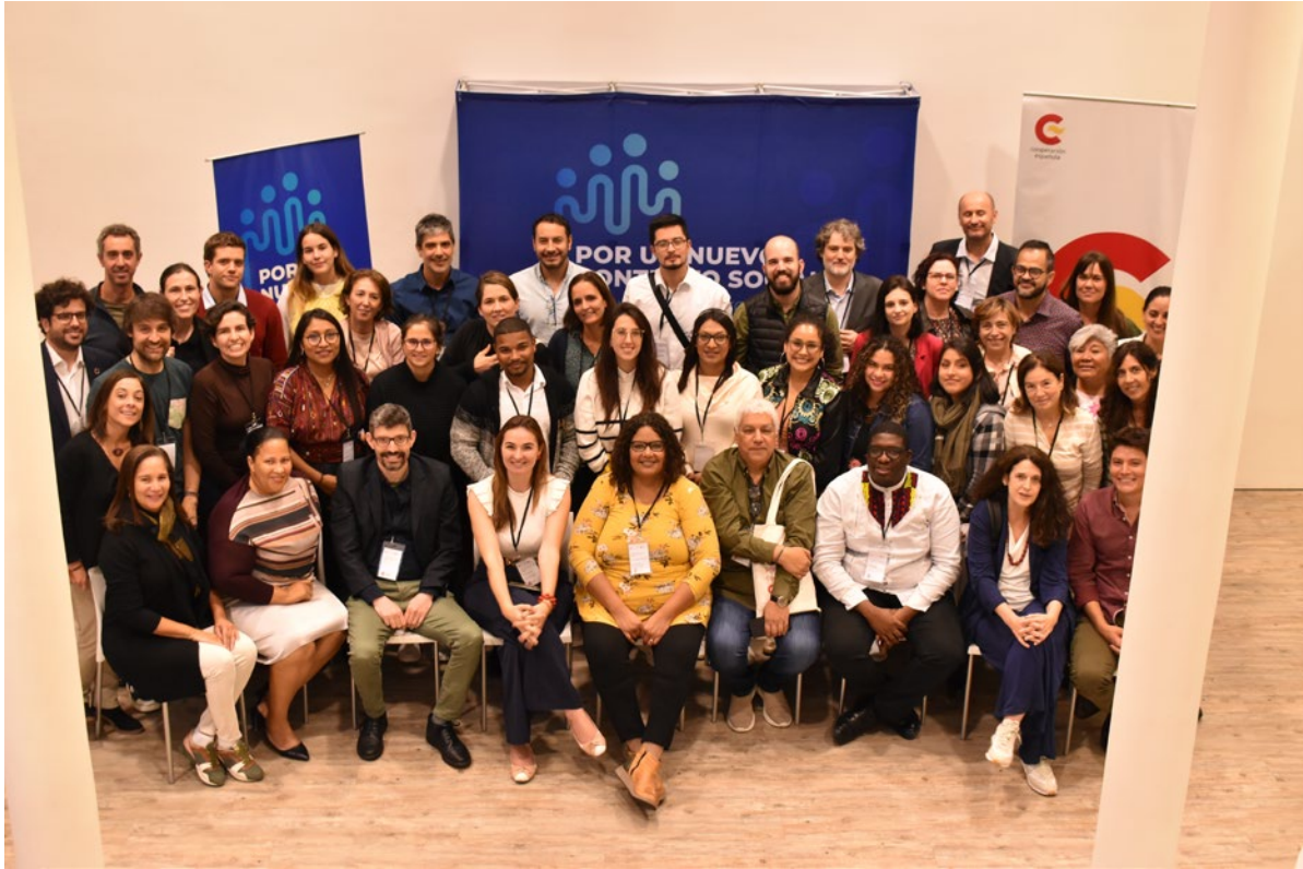
Foto grupal encuentro en Montevideo, Uruguay